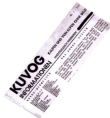
KUVOG (Compre y venda sin dinero), una iniciativa originada en Hannover en 1987 que nunca llegó a concretarse.

A fines de los setenta y comienzos de los ochenta, la gente redescubrió esta economía informal. Tareas del hogar y trabajos del tipo "hágalo usted mismo", junto con el pluriempleo y la nueva generación de trabajadores independientes que trabajaban en cooperativas recientemente establecidas. Muchas de las ideas analizadas en aquel momento sirvieron de base para el desarrollo de algunos sistemas de intercambio.