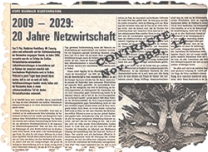
Panorama de la economía de trueque del año 2029 de S. Flor.