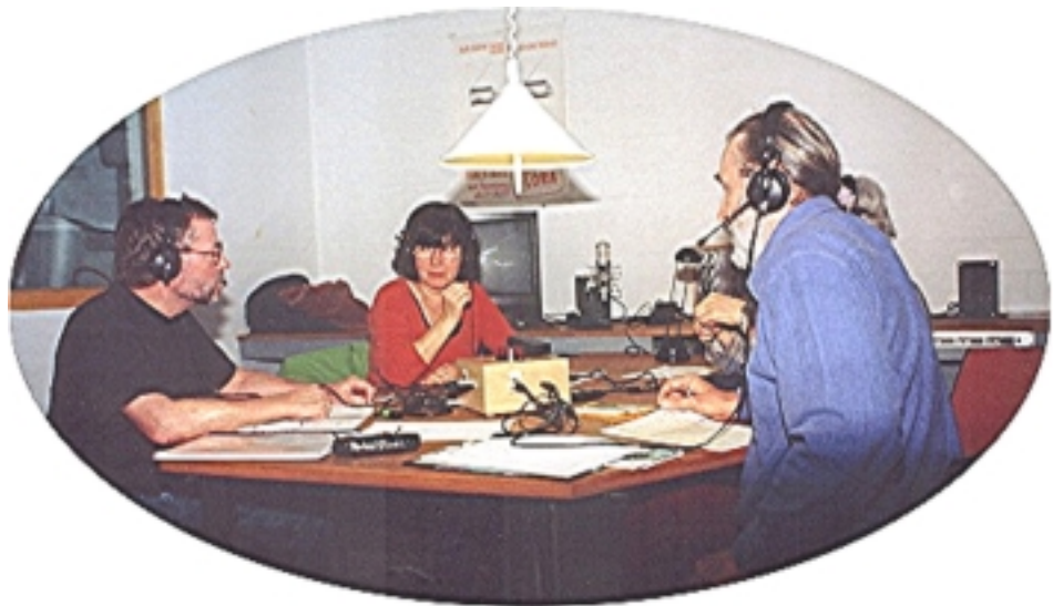
Die „Tausch-Welle“ ist ein monatliches Radioprogramm für die Region Hannover.

Als Tauschsysteme haben die Senioren-genossenschaften heute nur noch eine geringe Bedeutung. Einige haben die Verrechnung von Zeitpunkten völlig abgeschafft. Andere konzentrieren sich auf die Vermittlung von Freiwilligenarbeit, wobei die Teilnehmer ein kleines Entgelt in Euro oder aber in Form von Zeitgutschriften erhalten.